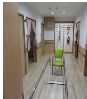
機能訓練スペース